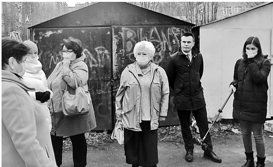
Встреча Уполномоченного с жителями микрорайона «Кукковка» г. Петрозаводска 11