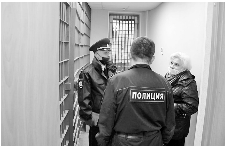
Посещение Уполномоченным изолятора временного содержания (г. Петрозаводск, ноябрь, 2020 г.)

ветственности, посещались изоляторы временного содержания, входящие в структуру МВД (в г. Петрозаводске). В результате этих посещений нарушений прав лиц, содержащихся в ИВС, не выявлено.