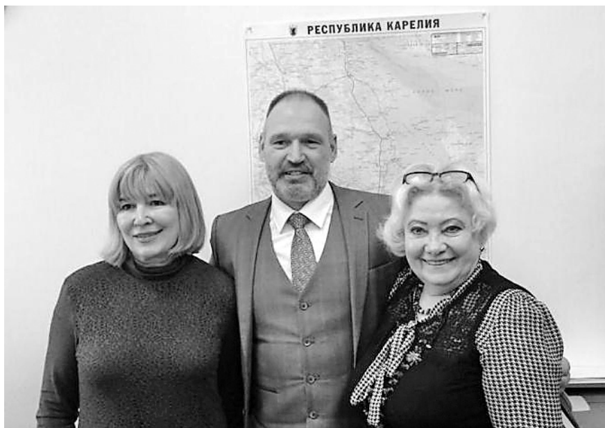
Уполномоченный по защите прав предпринимателей в Республике Карелия Е.Г. Гнетова, Уполномоченный по защите прав ребенка в Республике Карелия Г.А. Сараев, Уполномоченный по правам человека в Республике Карелия Л.Д. Бойченко

эффективных способов защиты прав и свобод, который, к сожалению, в 2020 году не был реализован в полной мере из-за введенных эпидемиологических ограничений на территории Российской Федерации и Республики Карелия.